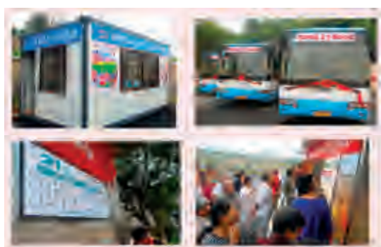
长沙金时房地产有限公司为21路公交车运行,无偿提供了始发站和调度室。