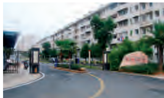
雨花区粟塘小区公租房正门,整洁有序。