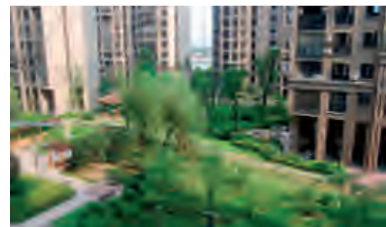
芙蓉区东岸梅园公租房小区一角,绿意盎然。