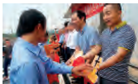
发放的公租房钥匙,传递的是市委市政府对普通劳动者的关爱之情。