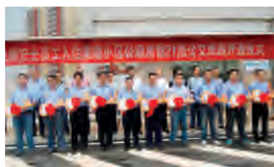
首批入住的驾驶员代表从领导手中接过公租房钥匙,喜悦之情溢于言表。

龙骧巴士驾驶员、修理工等一线员工来自五湖四海,外地员工居多,在长沙租房居住。房租费高、住房条件差、配套设施少的住房难问题非常突出。市委市政府高度重视外来务工人员的住房问题,市住房保障局、市交通运输局近年来一直在积极探索有效途径,全力为外来务工人员提供更多帮助,尽力为他们排忧解难。