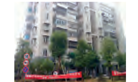
雨花区长房凤凰佳园公租房小区楼前剪影,绿树环绕。