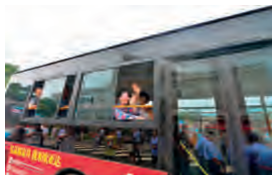
雨花区栗塘小区的居民们欢欢喜喜地搭乘首发21路公交车