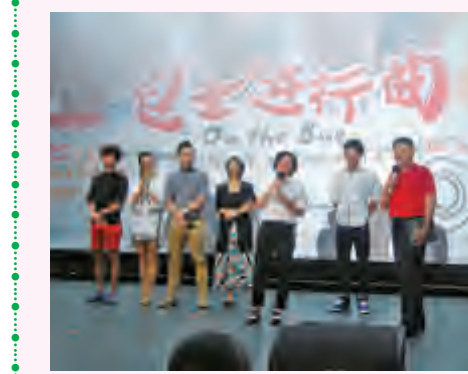
对酷暑湿，可以按足三里穴，有助于运化水湿。

7月9日下午3点，首部反映公交人生活的励志电影《巴士进行曲》在长沙潇湘国际影城阿波罗旗舰店举行首映。