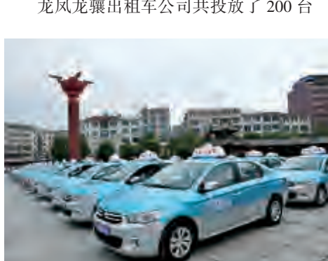
龙凤龙骧出租车公司共投放了200台