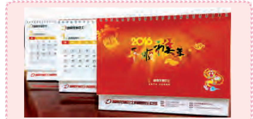
公司以上年度评选出的优秀员工和优秀员工外出参观学习的相关照片为素材制作年历，发放给公司每一位员工。图为龙骧巴士2016年台历。(任婷)

事后，乘客们纷纷赞许钟师傅尽职尽责。钟师傅感叹道：“如果携带汽油上公交车，检查不严，一不小心就会酿成悲剧。”(任婷)