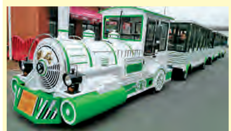
日前，一车间对橘子洲观光小火车的车容车貌进行了整修。图为整修后焕然一新的观光小火车。

同时，车队值班室来了一位神色慌张的女士，女士到达车队值班室后，立即向值班人员说明事由：“我陪姐姐来湘雅二医院看病，下午5点多在湘雅二医院站上了11路公交车，脱外套时随手将手提包放在了车厢座位上，在终点站赤岗冲下车时却忘记拿了，包内有现金5000