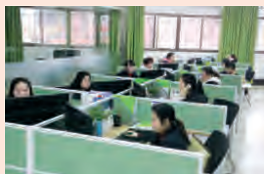
智能运营管控中心14名调度员是公司1463台公交车的14双“千里眼”,她们对所有车辆以及运行道路情况进行实时监控和调度。