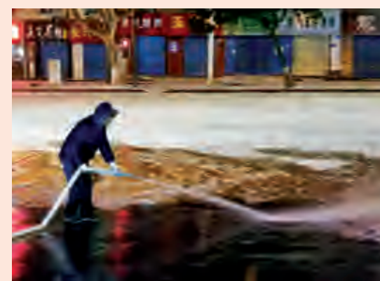
夜间作业,保障白天车辆正常运营。