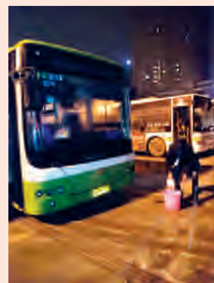
为保证车辆准时发出,驾驶员提前到岗,除车窗上的冰。

车,这样可以提醒后车减速以避免追尾。行车中转弯应尽量使方向盘平稳,避免在弯道中纠正方向使车辆侧滑。特别要提醒的是,在冰雪路面回正方向的时机,应略早于正常路面。如果遇到降雪太大,以致无法判断前方路面情况时,应及时靠路边停车并亮起双跳灯,待视线达到行车要求时再继续行驶。