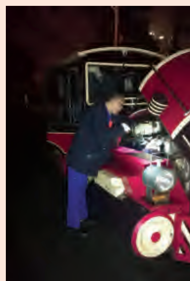
为保障小火车正常运行,维修人员连夜检查。