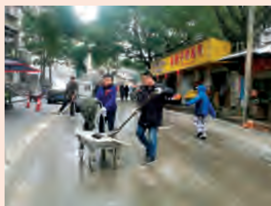
一车间组织员工在全盆岭上坡位置铲雪,方便行人、车辆通行。