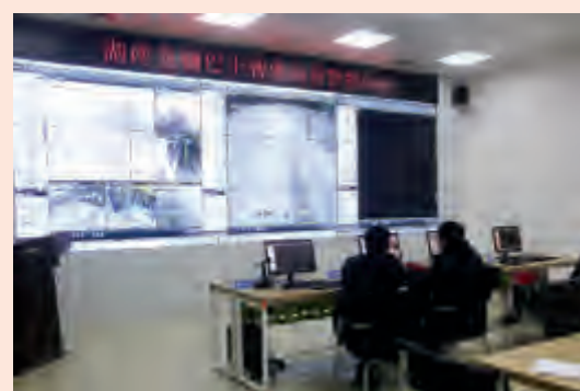
智能运营管控中心是公交运行的“大脑”,实时监控57条公交线路,1463台公交车,57条公交线路,没有一条停运。