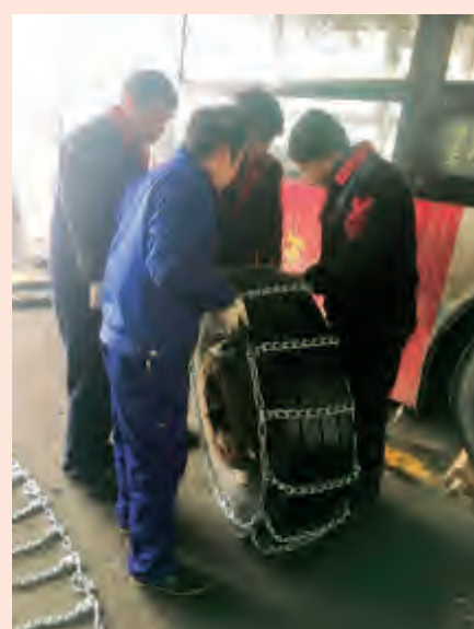
为了降低车辆打滑风险,维修人员为车辆安装防滑链。