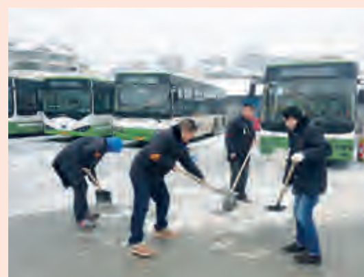
龙二队组织驾驶员在公交停车坪铲积雪。