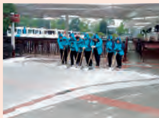
龙骧橘子洲观光旅游车队组织员工在橘子洲景区铲雪。