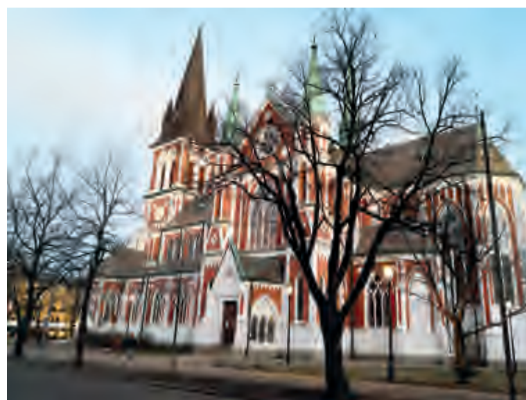
丹麦哥本哈根的阿美林堡宫，这座大型建筑是坚实要塞与华丽宫殿的绝妙组合。