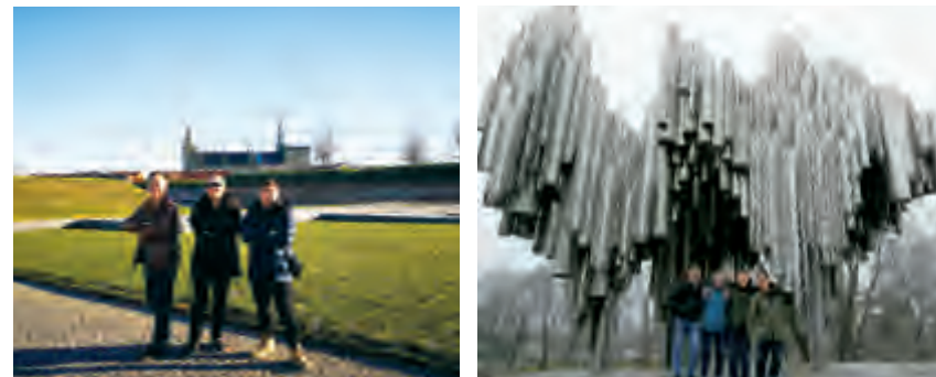
北欧不同景点前的合影